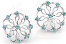
WB2W40-001 Ohrstecker single gross Weissgold 750 18 Turmaline 0.30ct. Limitierte Auflage