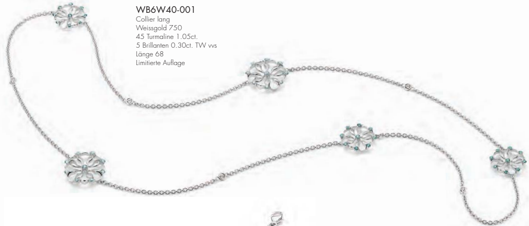
WB6W40-001 Collier lang Weissgold 750 45 Turmaline 1.05ct. 5 Brillanten 0.30ct. TW vs Länge 68 Limitierte Auflage