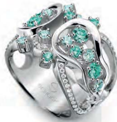
WB12W41-001 Ring Weissgold 750 18 Turmaline 1.22ct. 78 Brillanten 0.89ct. TW vs Limitierte Auflage