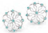
WB1W40-001 Ohrstecker single klein Weissgold 750 18 Turmaline 0.24ct Limitierte Auflage