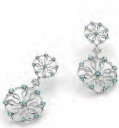
WB3W40-001 Ohrhänger 2er klein Weissgold 750 36 Turmaline 0.85ct. 2 Brillanten 0.20ct. TW vs Limitierte Auflage