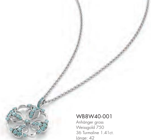
WB8W40-001 Anhänger gross Weissgold 750 36 Turmaline 1.41ct. Länge: 42 Limitierte Auflage