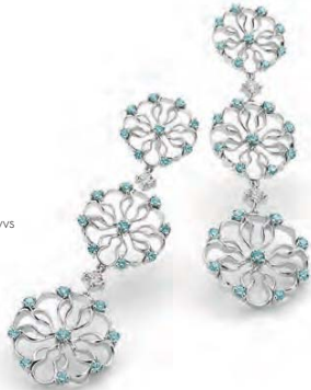
WB5W40-001 Ohrhänger 3er Weissgold 750 54 Turmaline 1.15ct. 4 Brillanten 0.30ct. TW vs Limitierte Auflage