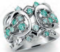
WB11W40-001 Ring Weissgold 750 18 Turmaline 1.22ct. Limitierte Auflage