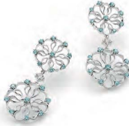
WB4W40-001 Ohrhänger 2er gross Weissgold 750 36 Turmaline 0.91ct. 2 Brillanten 0.20ct. TW vs Limitierte Auflage