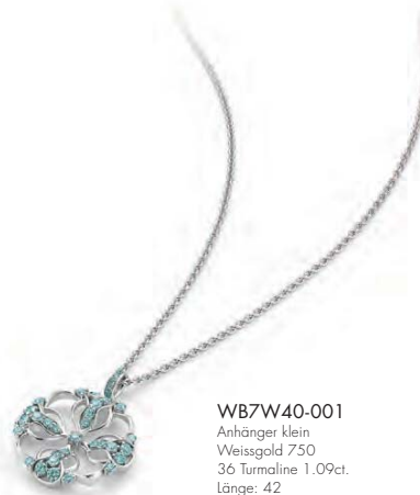
WB7W40-001 Anhänger klein Weissgold 750 36 Turmaline 1.09ct. Länge: 42 Limitierte Auflage